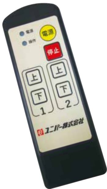
無線リモコン送信機